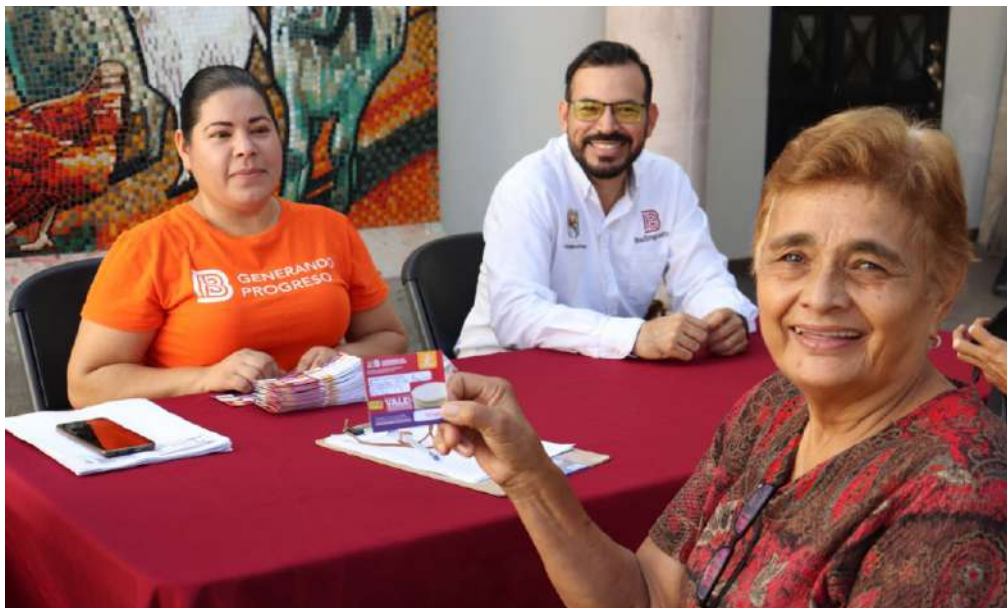
EJE 1 BIENESTAR SOCIAL

Impulsar el bienestar integral de la población de Badiraguato mediante políticas públicas orientadas al acceso universal y equitativo a la salud, la cultura, el deporte y la asistencia social, disminuyendo los niveles de rezago y pobreza, y promoviendo una vida digna para todas y todos.